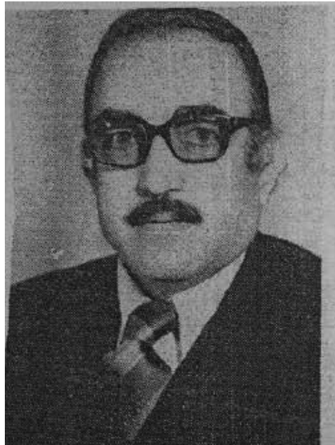
جريدة روابط القرى العميلة